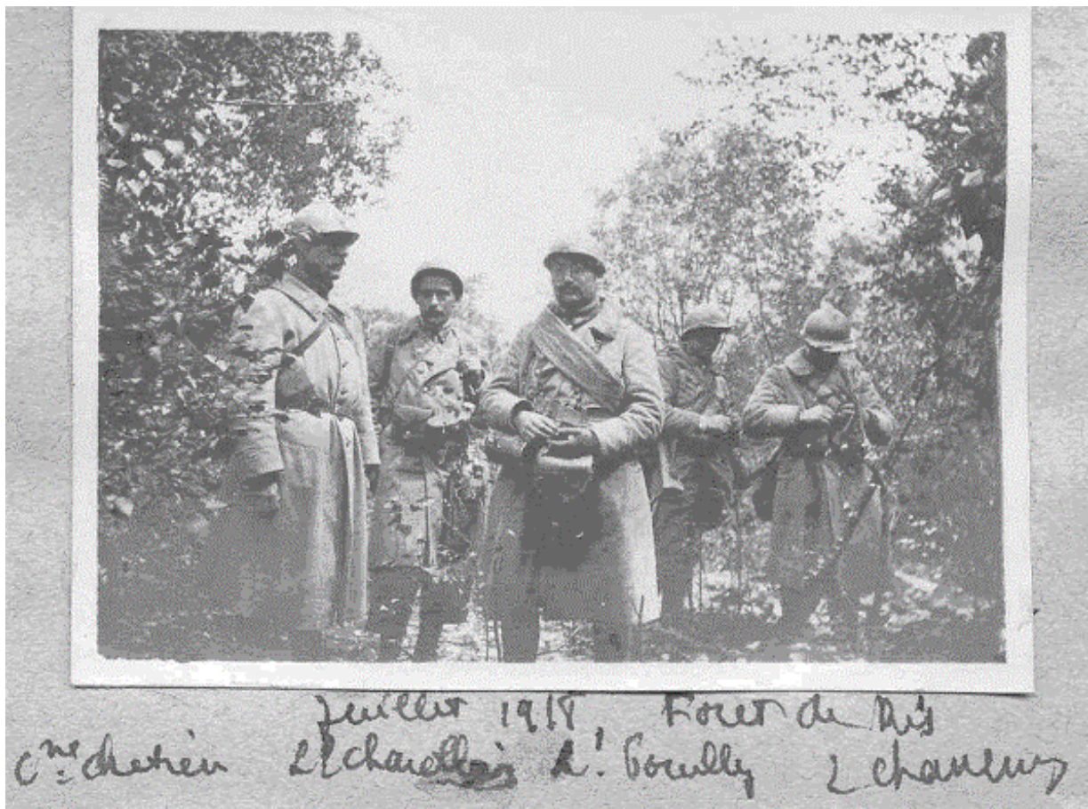
Copyright General de Butler (Juillet 1918, Forêt de Ris, Cne Chrétien, Lt Charellais, Lt Brouilly, 2 Chasseurs)